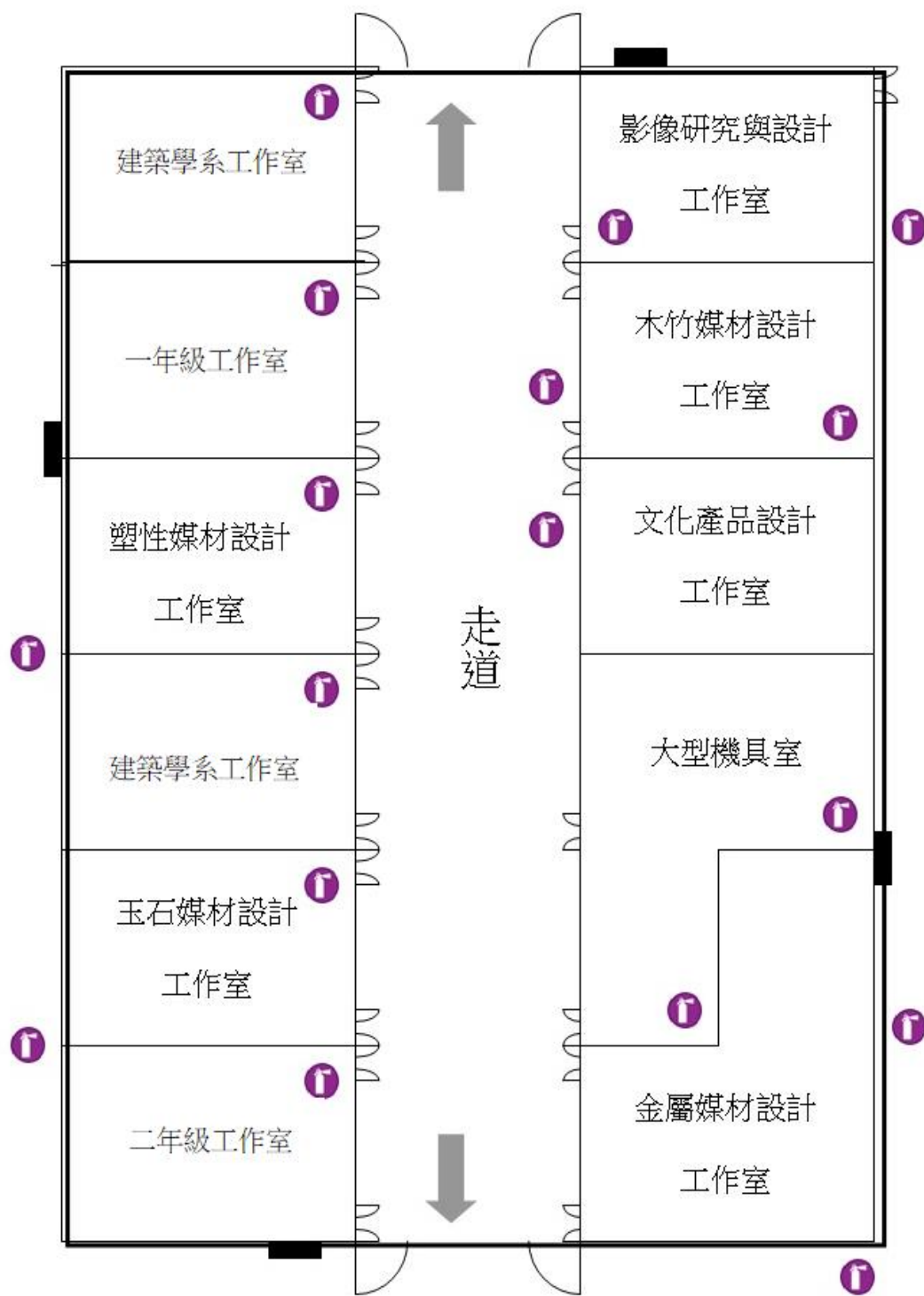
綜合大樓地下室教室配置圖